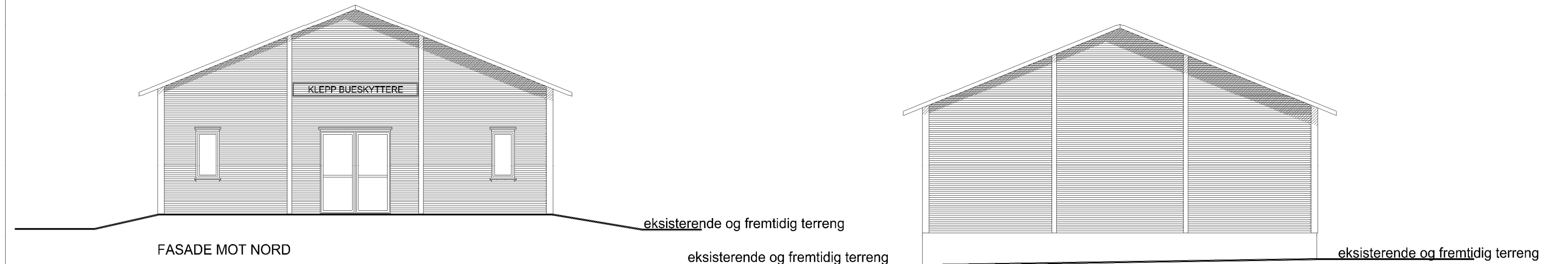
FASADE MOT NORD